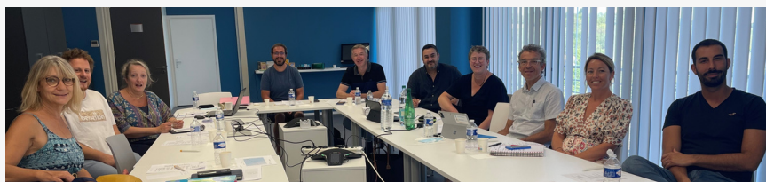
Réunion de bureau du 04 août 2022