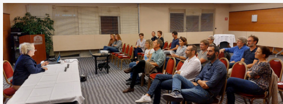
Notre première soirée-rencontre à Epinal