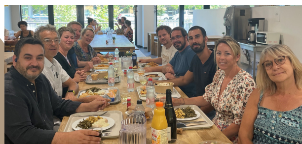
Déjeuner de travail des membres du bureau